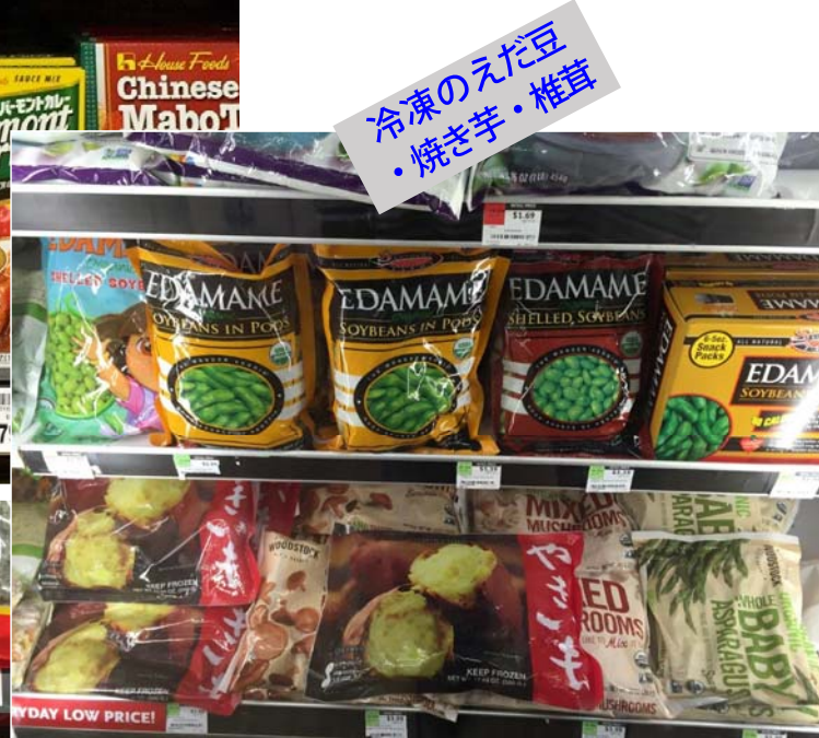
冷凍のえだ豆 ・焼き芋・椎茸