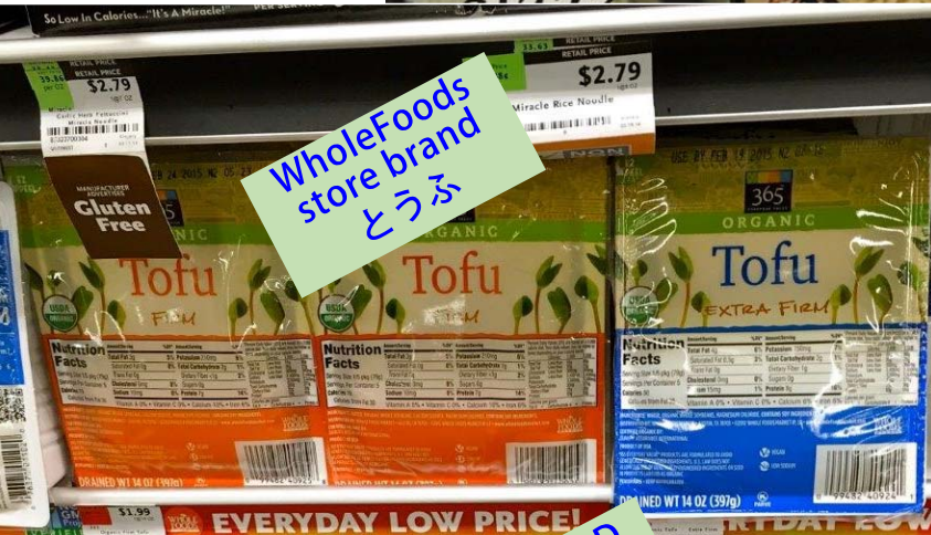
WholeFoods store brand とうふ