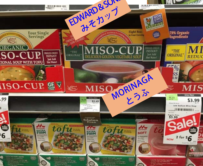
EDWARD & SONS みそカップ