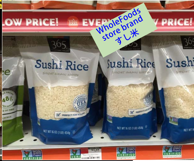
WholeFoods store brand すし米