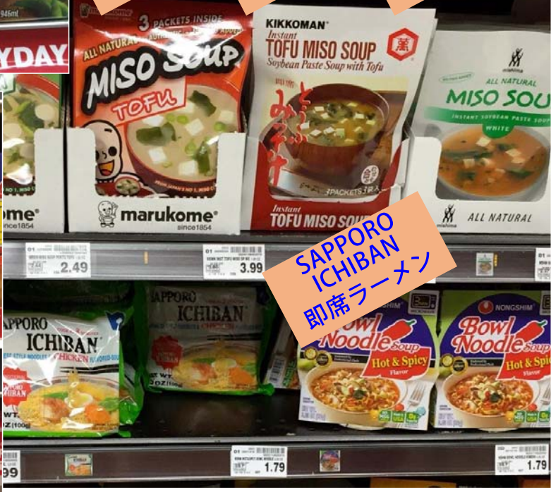
SAPPORO ICHIHAN 即席ラーメン