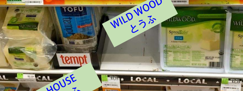
WILD WOOD とうふ