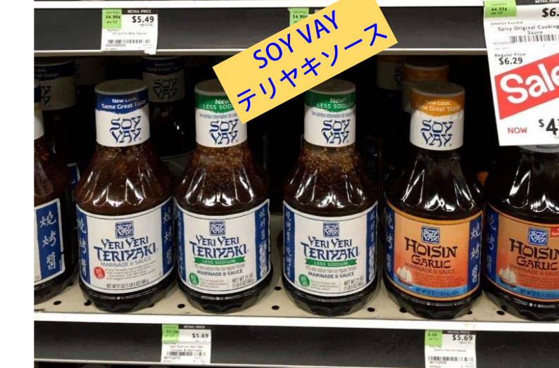
SOY VAY テリヤキソース