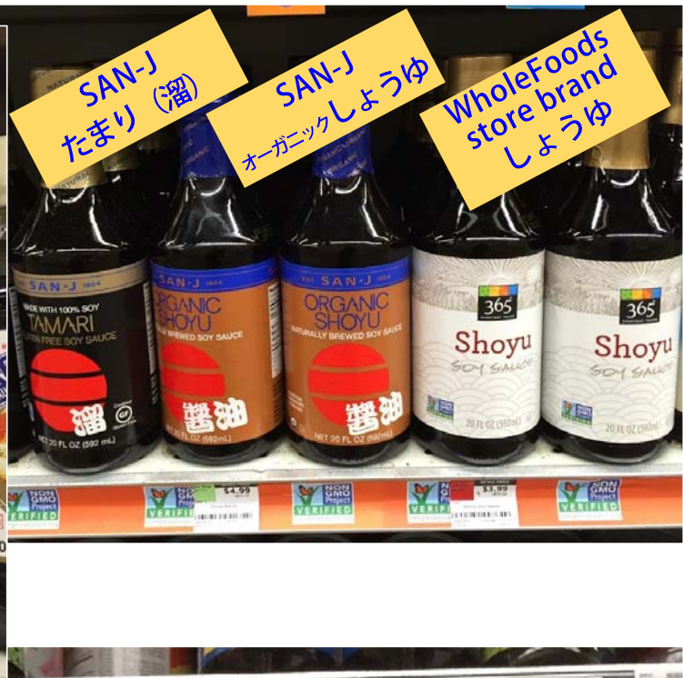
SAN-J たまり (溜)