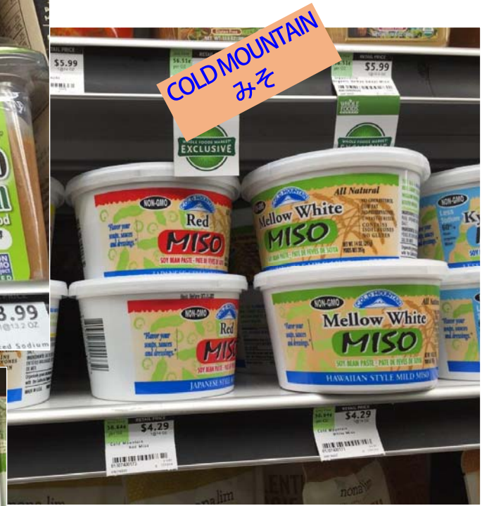
COLD MOUNTAIN みそ