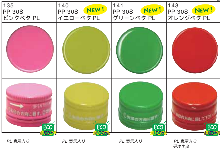
135 PP 30S ピンクベタ PL 140 PP 30S イエローベタ PL 141 PP 30S グリーンベタ PL 143 PP 30S オレンジベタ PL