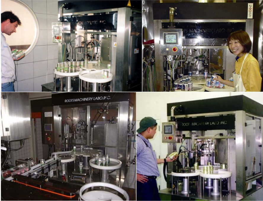
地ビール醸造所で小規模商業生産に使用されている実例。(シリーズII、シリーズIIIを含む)