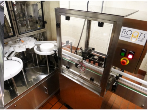
ピアラディスクの前に設置したオプションの「3ヘッド水リンサー」。「日付印字(インクジェット)」も搭載可能です。