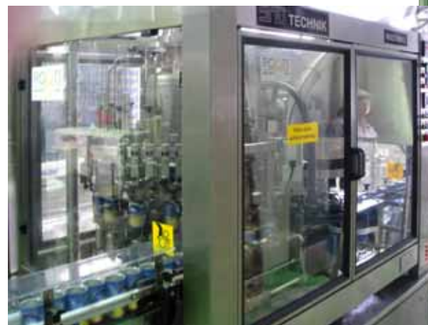
入口側から機械全景 View from infeed side 15ヘッドの充填部 15 head rotary filler 蓋供給とガッシング装置 Cover feed and under-cover gassing 4ヘッド缶シーマー 4 head rotary seamer