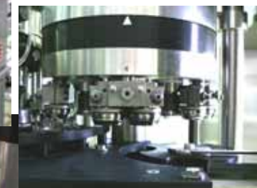
デパレタイザー Depalletizer デパレ上部 Over view of depalletizer ツイストリンサー Twist rinser