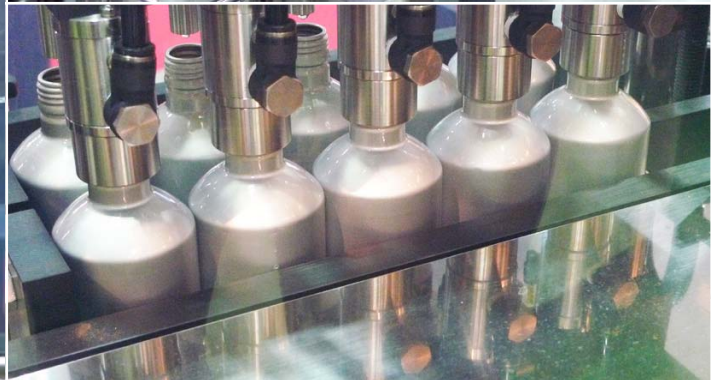
ボトル缶用にはフランス ZALKIN ヘッドを採用。(他のヘッドの搭載も可)