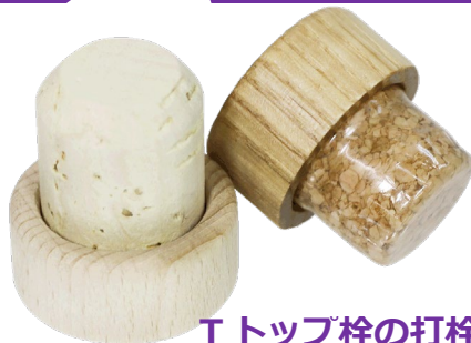
T トップ栓の打栓機