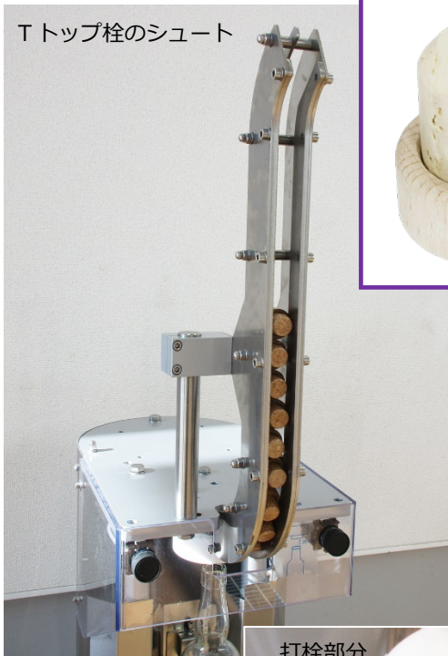
T トップ栓のシュート