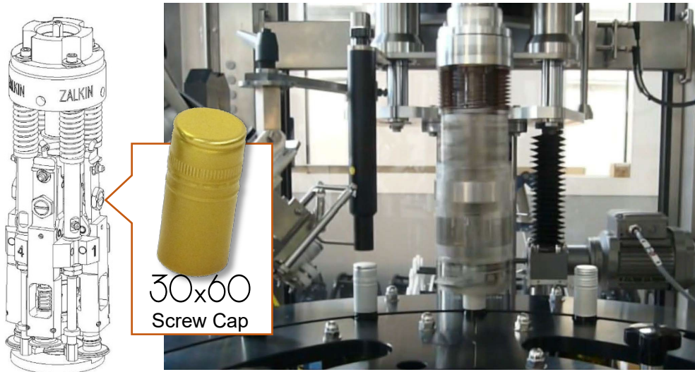
● type 104, roll-on capping head for 30x60