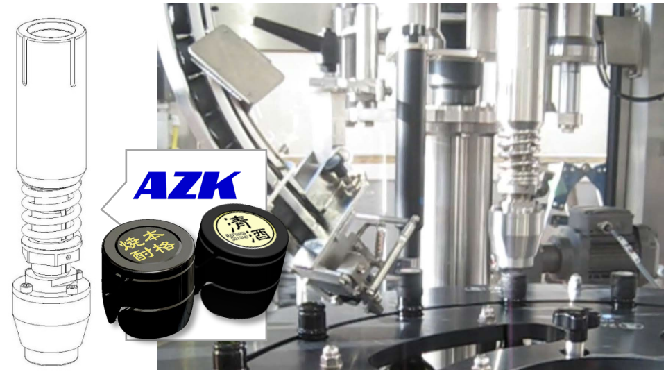
● type TER, push-down capping head for AZK, Saké Cap