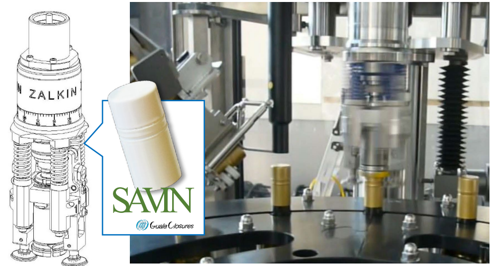
● type VS110, screwing / sealing head for SAVIN, pre-threaded 30x60