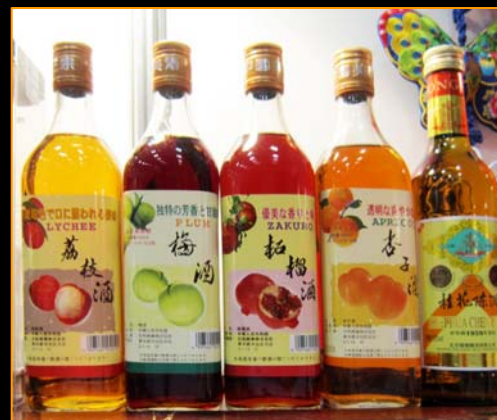
中国のリキュール ライチ・梅・むくろ・杏子など