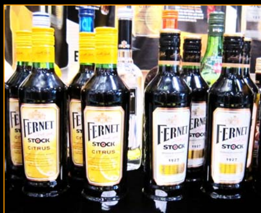
チェコのリキュール「シトラス」系