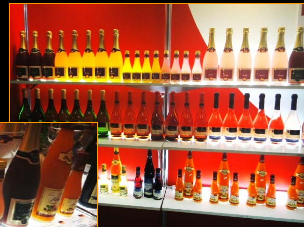
ドイツの フルーツスパークリング、 マンゴー、ブルーベリーなど