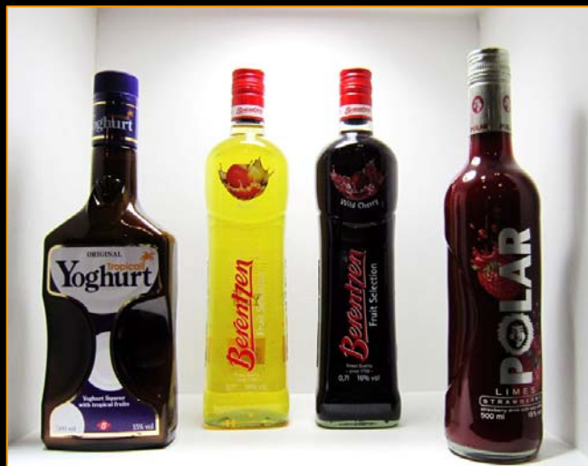
フランスのリキュール ヨーグルト・りんご・ワイルドチェリー・いちご