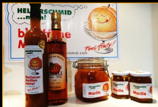
オーストリアの杏のリキュール