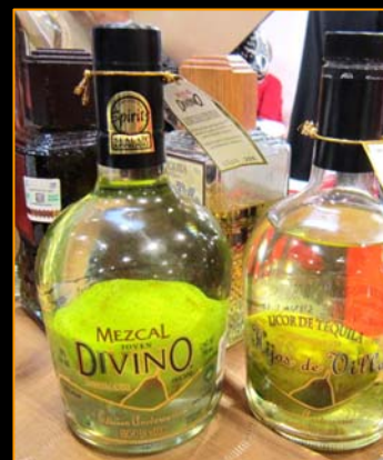
メキシコの 洋なしの蜜入り