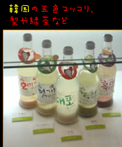
韓国の五色マッコリ、 梨や緑茶など