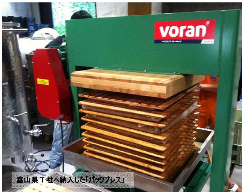
富山県 T 社へ納入した「パックプレス」