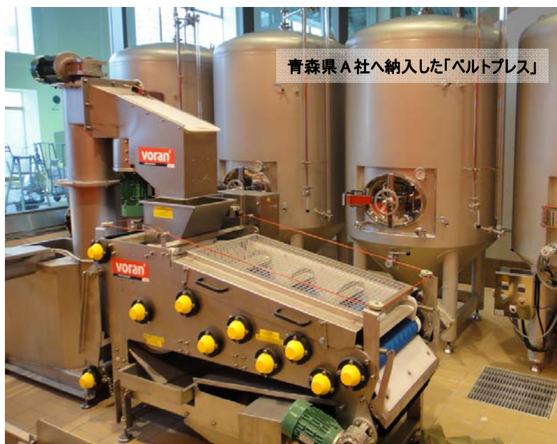
青森県 A 社へ納入した「ベルトプレス」