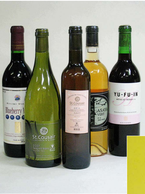
麻屋葡萄酒 (山梨) 由布院ワイン (大分) ブルーベリーワイン (石川)

NOMACORC in JAPAN @2010 ノマコルク@日本ワイン@2010年