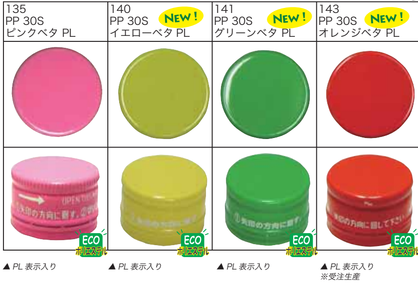
▲ PL 表示入り ▲ PL 表示入り ▲ PL 表示入り ▲ PL 表示入り ※受注生産