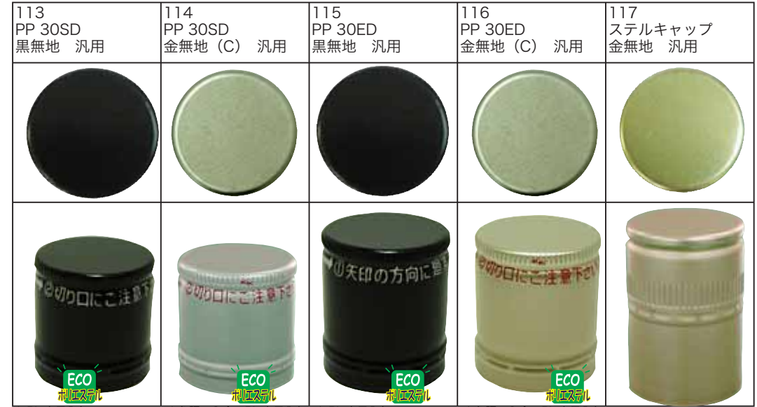
▲ PL 表示入り ▲ 色調：C金、PL 表示入り ▲ PL 表示入り ▲ 色調：C金、PL 表示入り