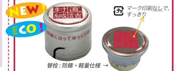
替栓：防錆・軽量仕様 →