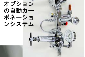
オプションの自動カーボネーションシステム