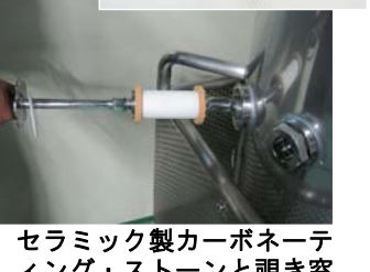
セラミック製カーボネーティング・ストーンと覗き窓