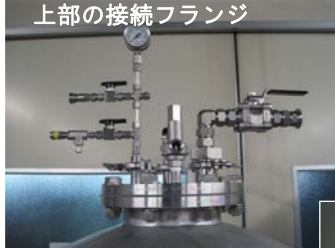
上部の接続フランジ