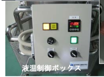
液温制御ボックス