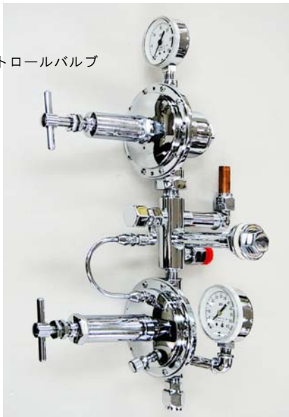
コントロールバルブ