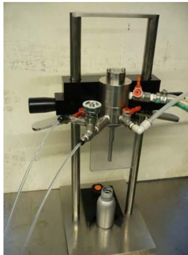
フレームつきハンドフィルター