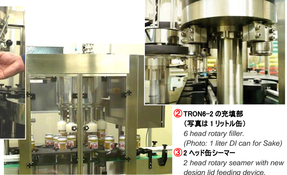
② TRON6-2 の充填部 (写真は 1 リットル缶) 6 head rotary filler. (Photo: 1 liter DI can for Sake) ③ 2 ヘッド缶シーマー 2 head rotary seamer with new design lid feeding device.