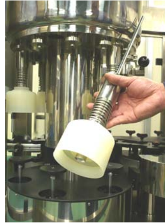
① 缶用の充填ノズル Gravity filler for can