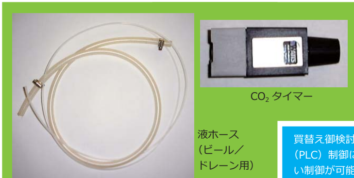
液ホース （ビール/ ドレイン用）