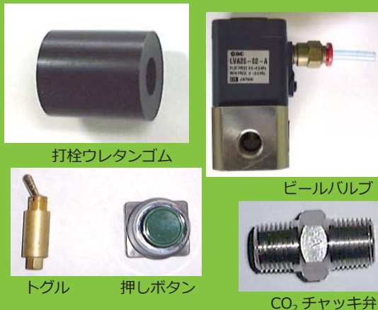
打栓ウレタンゴム

（オプション）バネ式打栓 ヘッド：中にビールなどが 入りやすく、オリジナルの ゴム式打栓ヘッドよりも安 定した作業が可能です。