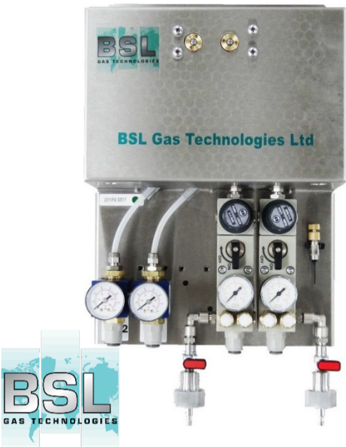
ガスブレンダー (CO 2 ガスと N 2 ガスの混合器)