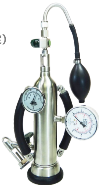
ボリュームメーター (タンク内の CO 2 ガスボリューム測定)