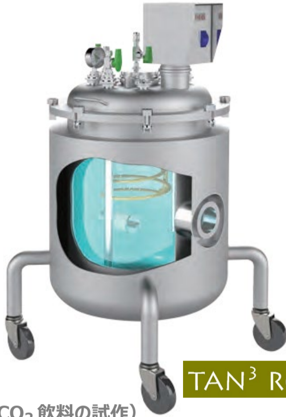
タンサンロボ (CO 2 飲料の試作)