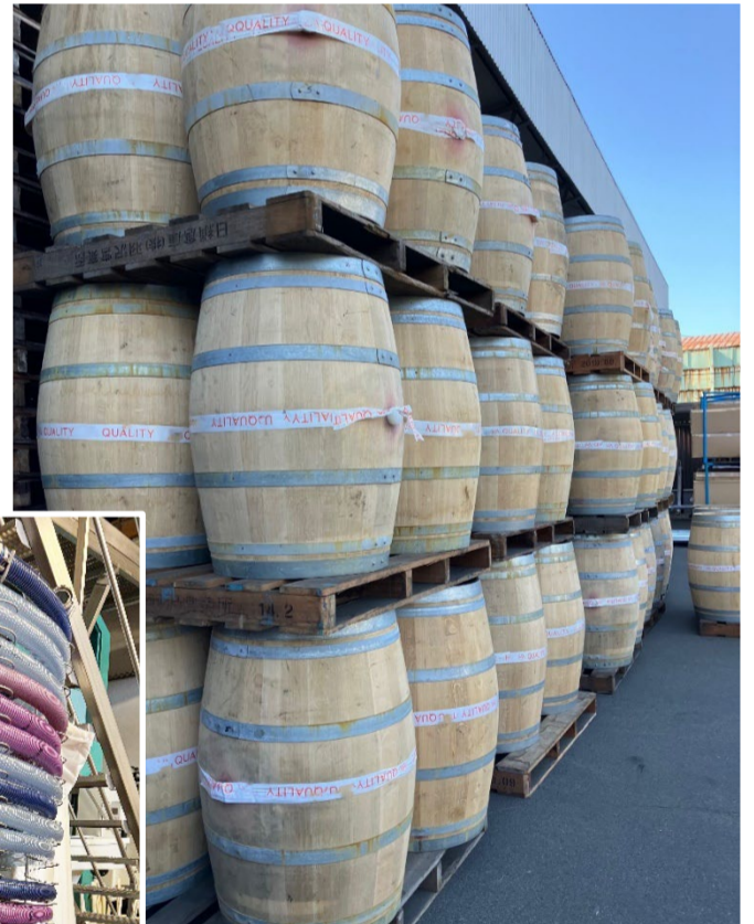
ビール貯蔵用の樽