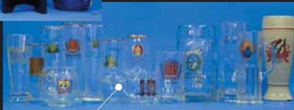
ドイツ製ビアグラス各種