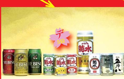
売れている、プレミアムセグメントのお酒とビールの缶: 「菊水」と「エビスビール」 (エビスビールは参考品)