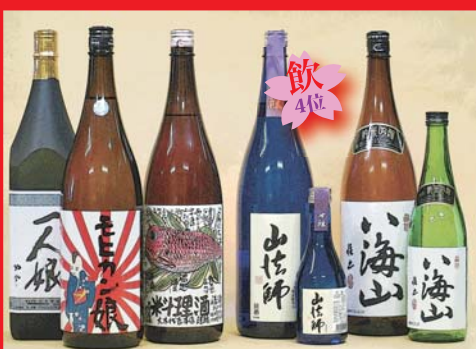
印象的なラベルの一升壺、一升壺とペアのパッケージ (王冠、びんなど。一部は参考品)