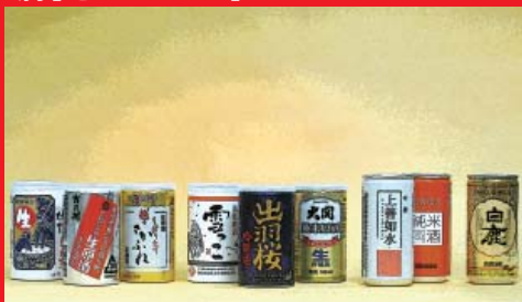
お酒のアルミ缶の事例 (204 径厚肉缶と 202 径薄肉缶)