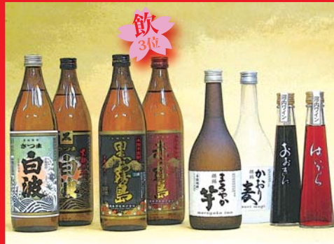
シリーズ・ラインナップの焼酎とワイン (キャップ)