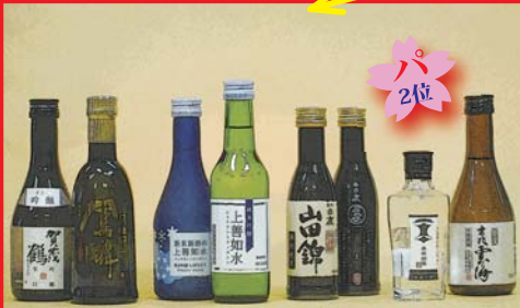
180 ml、300 mlの清酒や焼酎 (キャップ、ラベルなど)