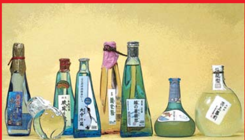
おもしろいデザインのびん (K2 オリジナルびん)