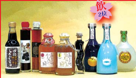
お酢、リキュール、醤油などのパッケージ (びん、ラベルなど)