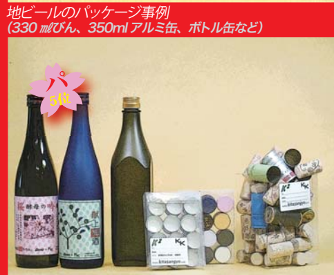
(当社の新製品 PR) 「不思議な 3D ラベル」、「ロールオンネジ」、「汎用デザインキャップ」、「各種ワイン栓」