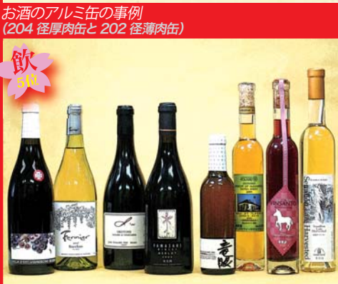
ワイン、スイートワインのパッケージ事例 (びん、ラベル、キャップシール、ワックスなど)