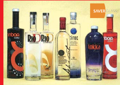
ラム、ウォッカなど: ブラジル、クロアチア、フランス (SAVER GLASS)