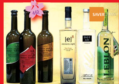
清酒、ラム、スピリッツなど: 日本、イギリス、ブラジル (SAVER GLASS、清酒のびんは当社が供給)