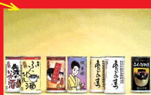
加熱機能のついたお酒 (加熱機能付き容器を生産しています - ISO9001 認証取得)