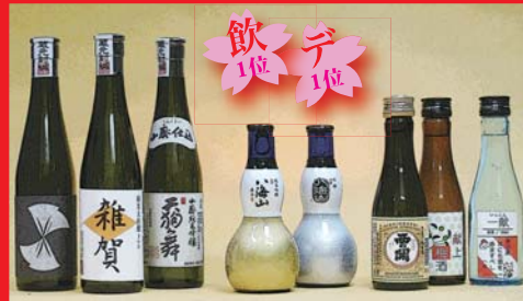
180 ml、300 mlの清酒 (びん、キャップ。一部はダミーラベル)