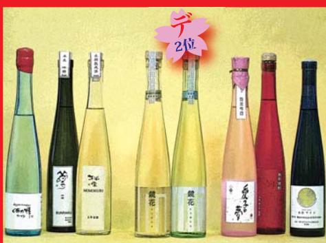
背の高いびんに入った、清酒、焼酎、ワイン (K2 オリジナルびん「SLIM375」) (カッコ内の表示は、当社が供給させていただいているパッケージング資材です。)