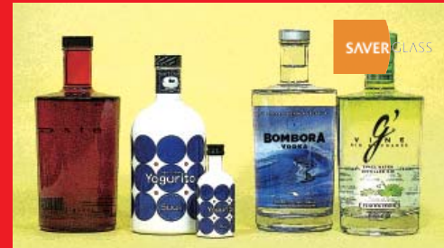
ジン、ヨーグルトリカーなど: フランス、オランダ (SAVER GLASS)