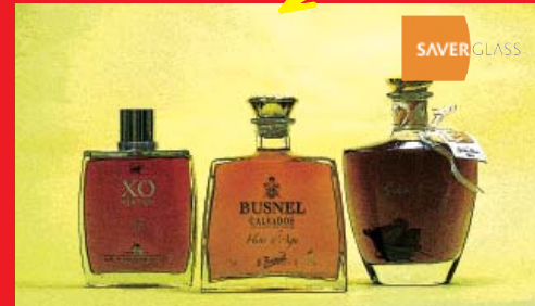
コニャック、カルバドスなど: フランス (SAVER GLASS)