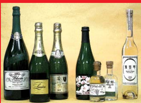
スパークリングワイン、シードル、ぶどう粕蒸留酒 (当社が輸入したびん)