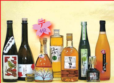
印象的デザインの梅酒 (びん、ラベルなど。一部参考品)