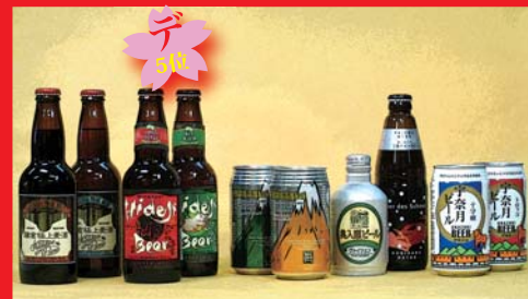
地ビールのパッケージ事例 (330 mlびん、350ml アルミ缶、ボトル缶など)