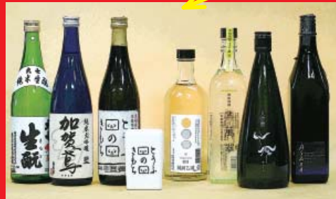
720 mlクラスの清酒や焼酎 (キャップ、びん、グラスなど)