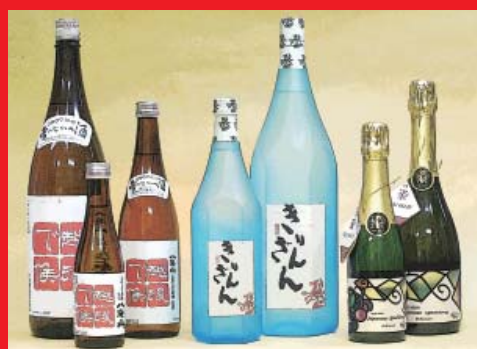
容量バリエーションの清酒とワイン (びん、キャップ)