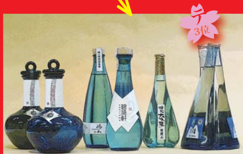
印象的なカタチのびんに入ったお酒 (留め型びんをご用命いただいた事例)