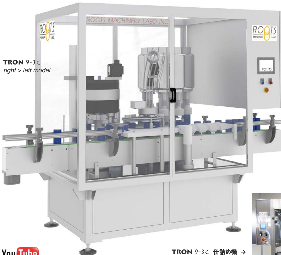
TRON 9-3C right > left model

びん詰め機シリーズ TRON 6-1B TRON 9-1B TRON 12-1B