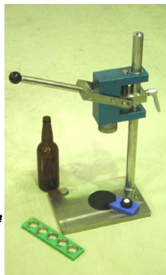
イタリアの手押し打栓機 左: シャンパン 29mm 王冠打栓ヘッドをつけた状態 右: 一般 27mm 王冠打栓ヘッドをつけた状態