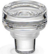
VL Clear HT