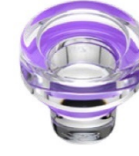
Coloured sealing ring