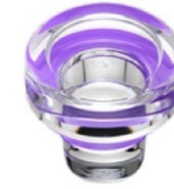
Coloured sealing ring