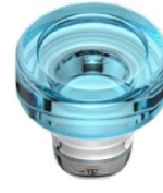
Colour coating - transparent