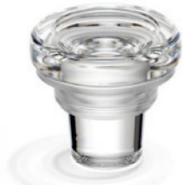
VL Clear LT

21.5・23 の LT・HT のガラス 栓の外径は 34mm です。 18.5・20 の LT・HT の外径 29.3mm と異なります。