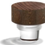
VL Clear Woody Dark brown

21.5・23 の Woody の外径は 34mm です。 18.5・20 の Woody の外径 29.3mm と異なります。