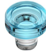
Colour coating - transparent