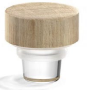
VL Clear Woody Beige