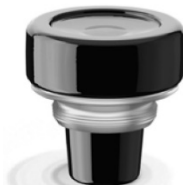
VL Black HT