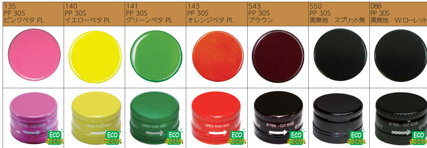
▲ PL 表示入り ▲ PL 表示入り ▲ PL 表示入り ▲ PL 表示入り ▲ PL 表示入り ▲ スプリットなし。 ▲ PL 表示入り