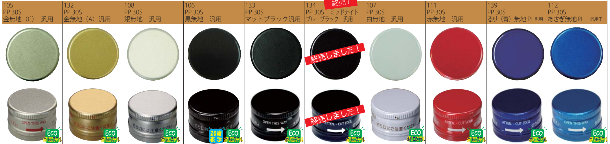
▲色調：C金、PL表示入り ▲色調：A金、PL表示入り ▲色調：銀、PL表示入り ▲PL表示入り ▲PL表示入り ▲PL表示入り、PL表示がわかりました。 ▲PL表示入り ▲PL表示入り ▲PL表示入り ▲PL表示入り ▲PL表示入り ▲PL表示入り ▲PL表示入り ▲PL表示入り